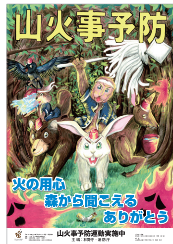
「全国山火事予防運動」ポスター