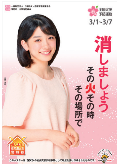
平成29年春季全国火災予防運動広報ポスター